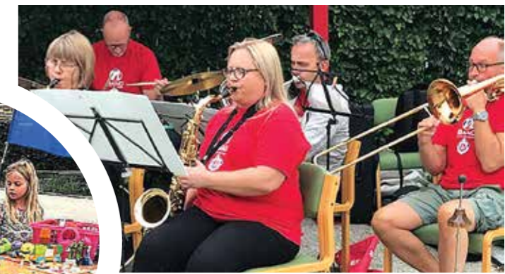
Stor suksess med Barnas Butikk; flere barn solgte leker de ikke bruker lengere til en billig penge, og mange fikk solgt det meste. Flere salgsboder og mye spennende varer ble tilbudt.